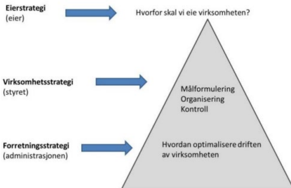
Figur 3: Samanhengane i ein eigarstrategi (kjelde: Asker kommune sin eigarmelding)

Samanhengane kan skisserast på følgande måte: